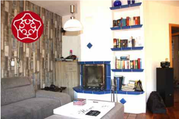
Gemütlich mit Kamin