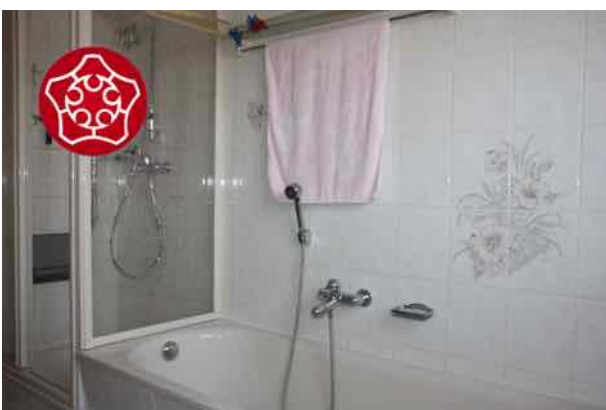
Wanne u. Dusche DG