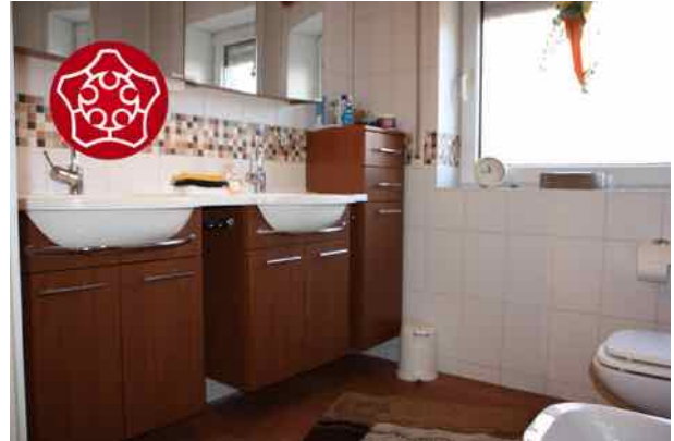
Edles Bad -