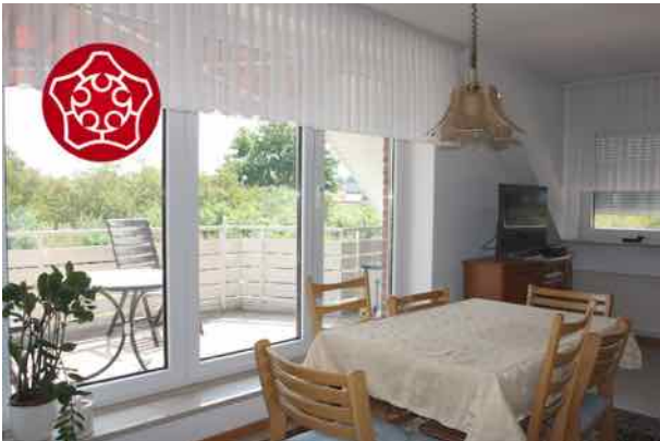
Essen mit Ausblick