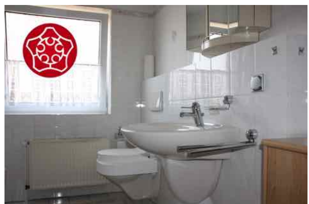
geräumiges Bad im DG