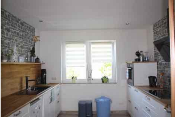
Küche nicht im Preis enthalten