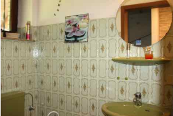
Gäste WC wartet auf Verschönerung