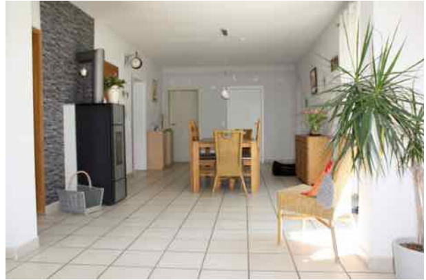
Essbereich mit Ofen