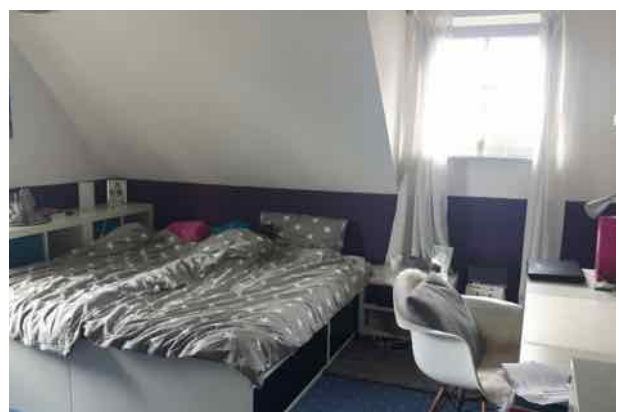
Freiraum zum Leben