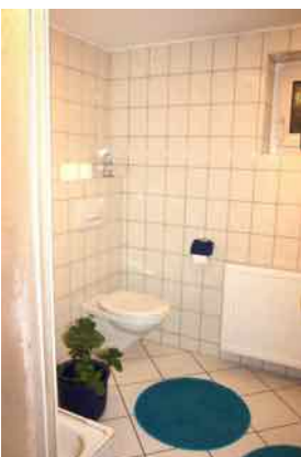
Dusch Bad im Souterrain