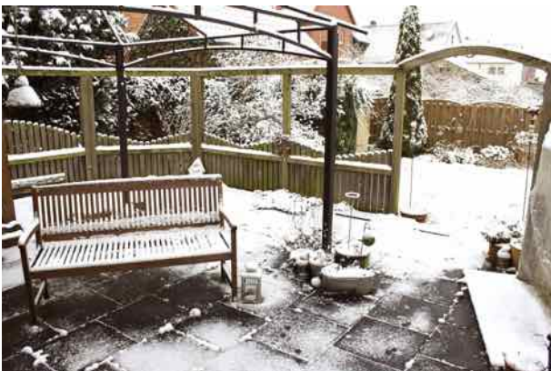
Gartenterrasse mit Pergola